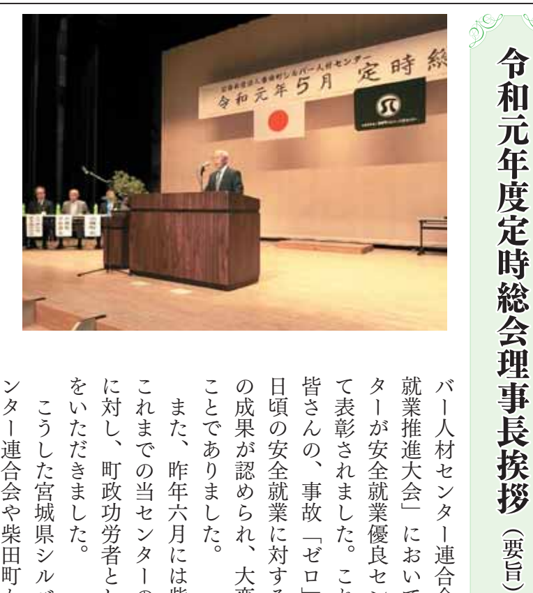
令和元年 10 月 発行 (2)