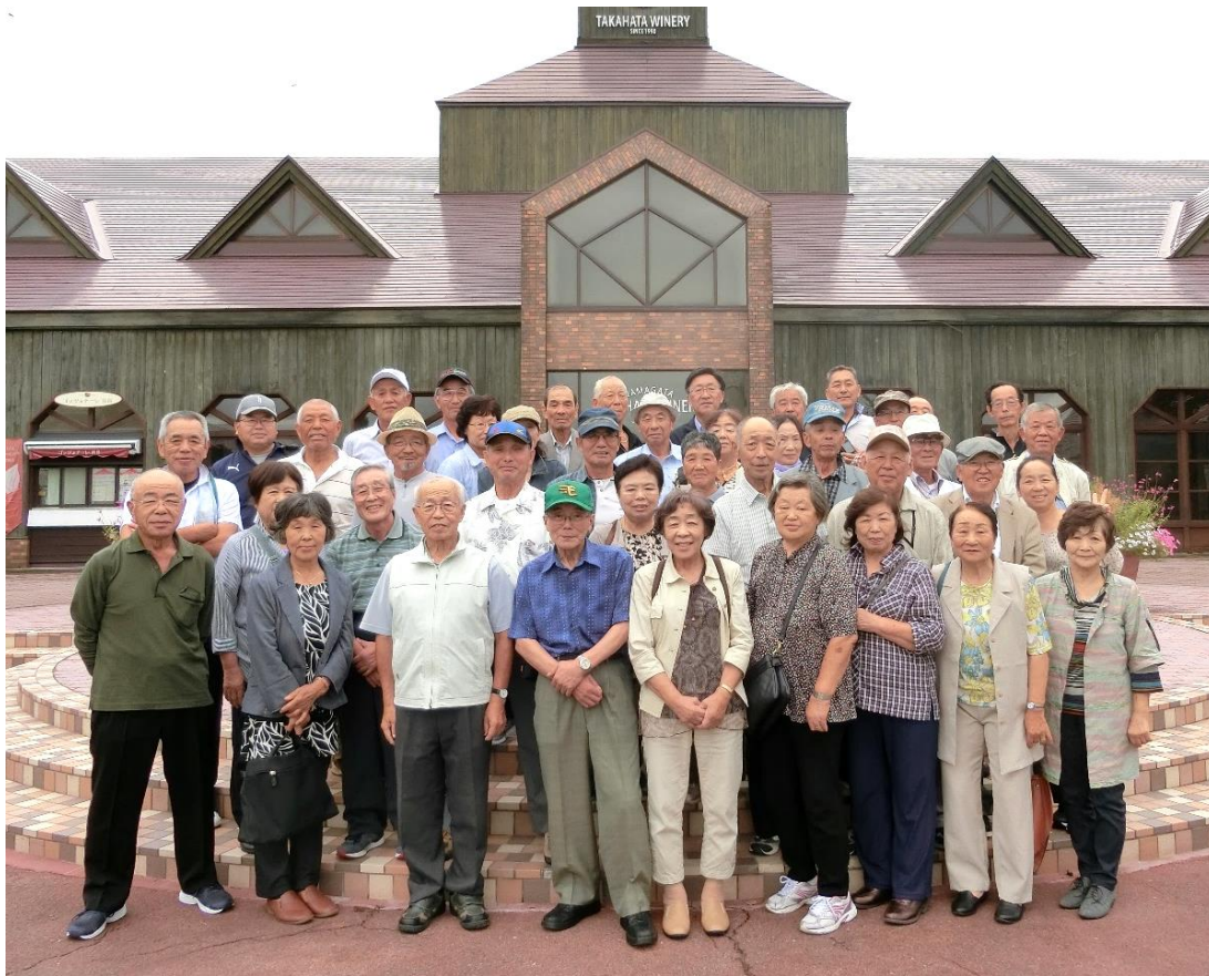
高島ワイナリーで記念撮影、参加者全員揃っているかな？