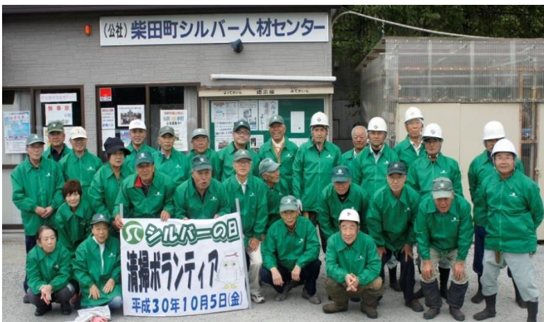
センター・船迫公民館