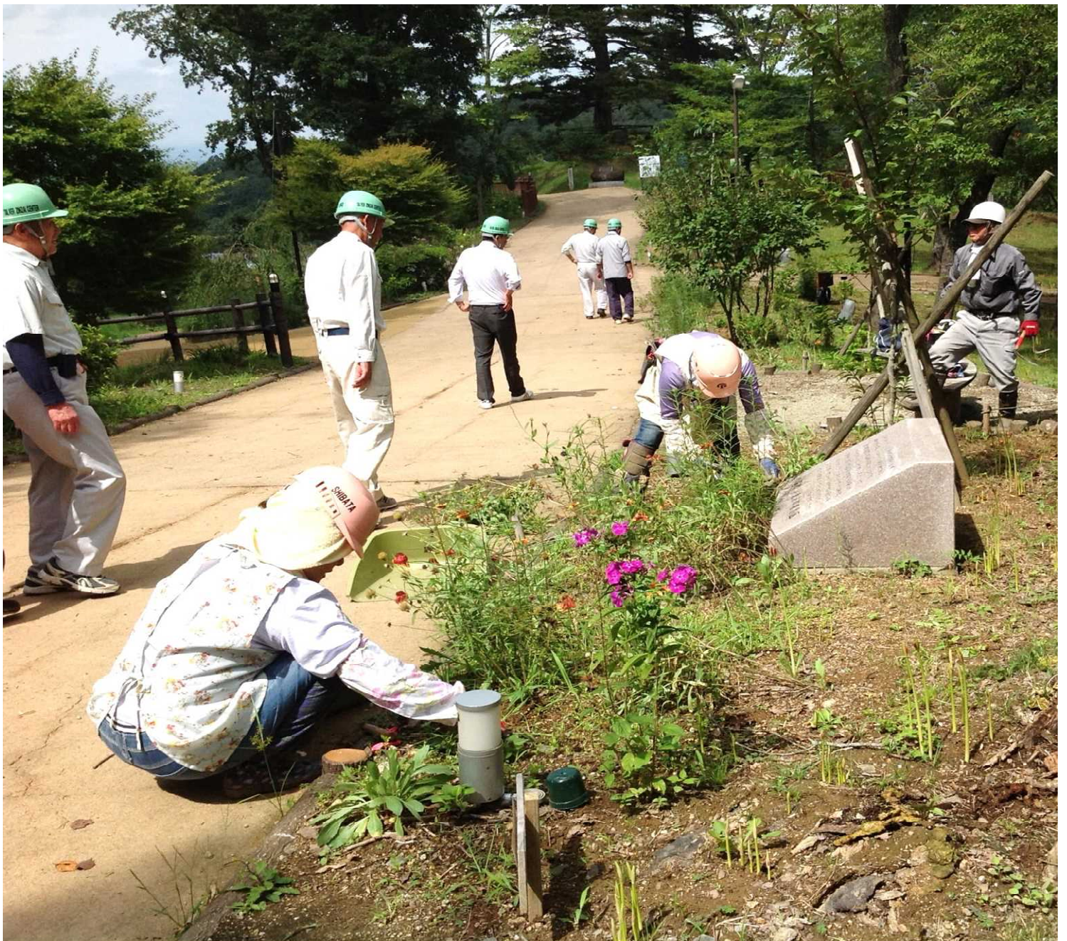
9月13日 曼珠沙華まつり準備中に、安全パトロール（安全管理委員会）を実施しました。